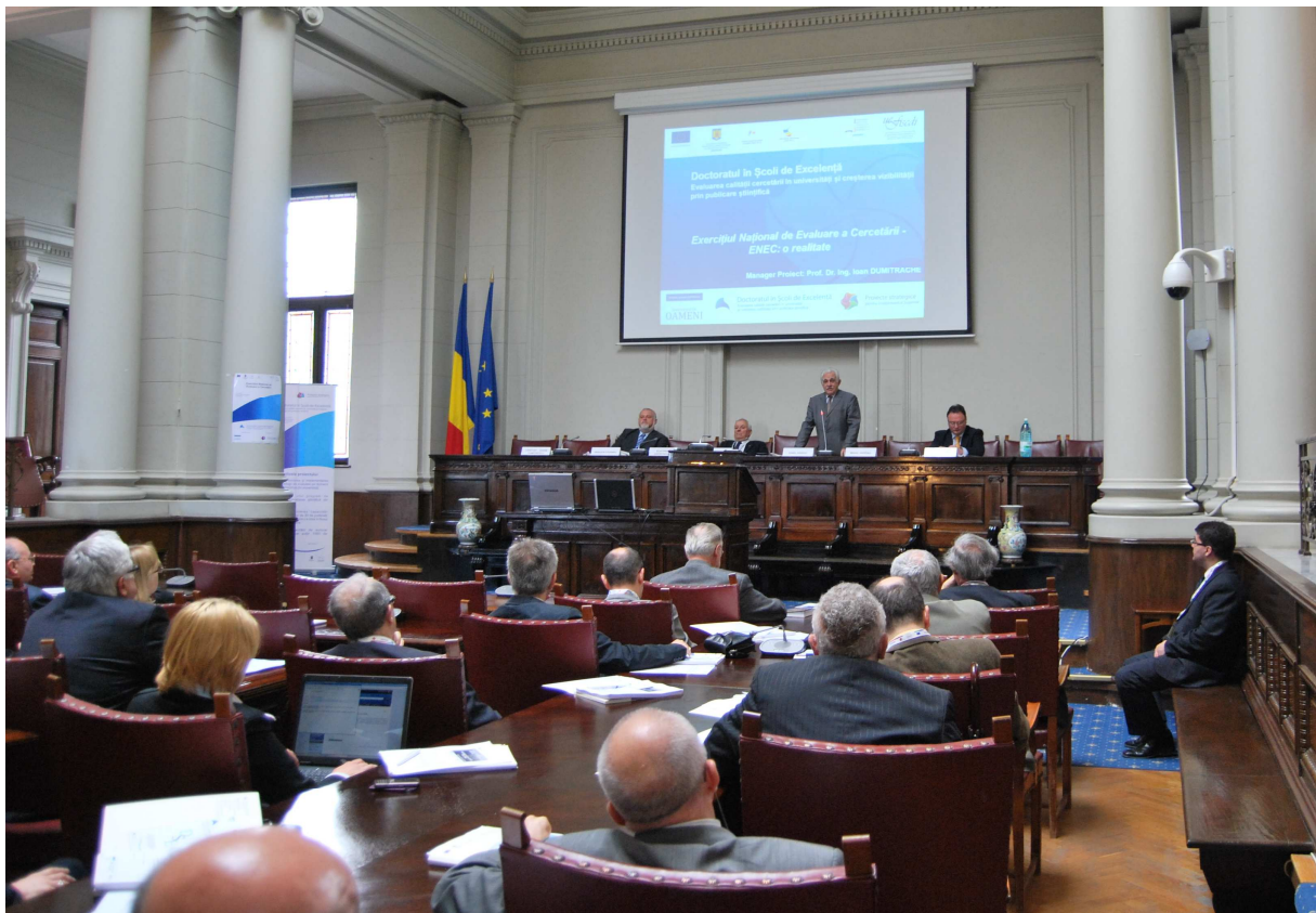
Proiect cofinanțat din Fondul Social European prin Programul Sectorial Dezvoltarea Resurselor Umane 2007-2013