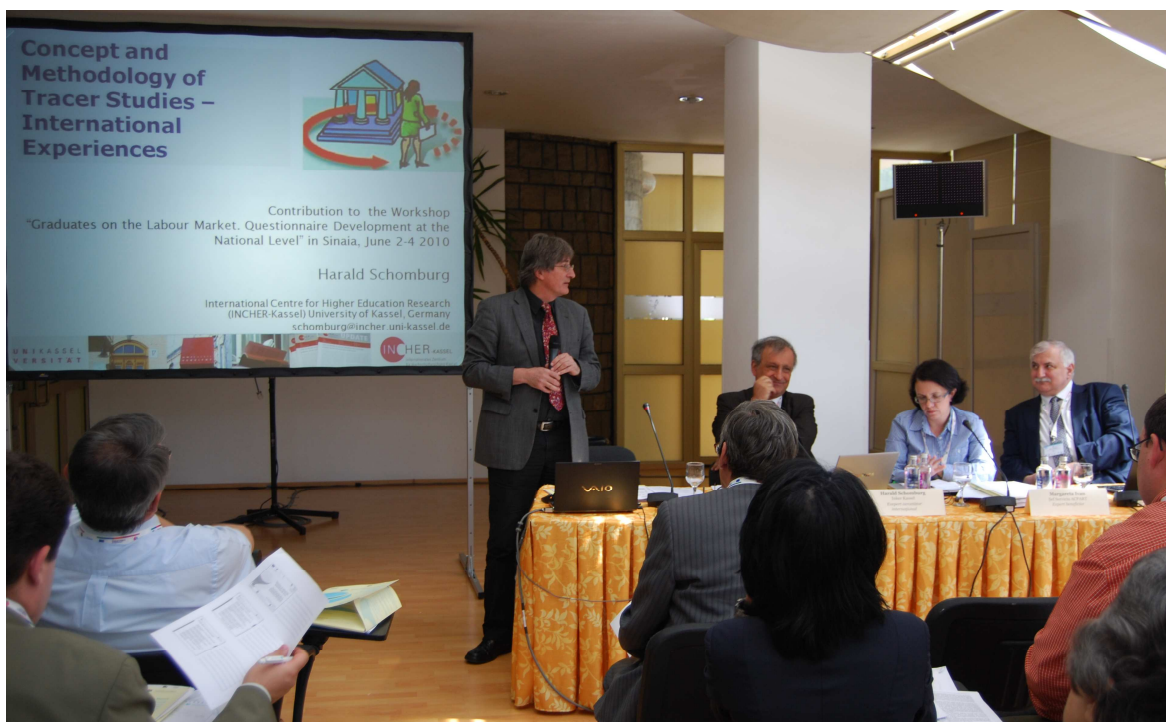
Proiect cofinanțat din Fondul Social European prin Programul Sectorial Dezvoltarea Resurselor Umane 2007-2013

Proiectul Absolventii si Piata Muncii isi propune sa raspunda mai multor nevoi identificate la nivelul societatii civile si al pietei muncii, printre cele mai importante fiind: imbunatatirea calitatii procesului didactic, prin corelarea acestuia cu cerintele pietei muncii si cu aptitudinile, competentele si abilitatile dobandite de