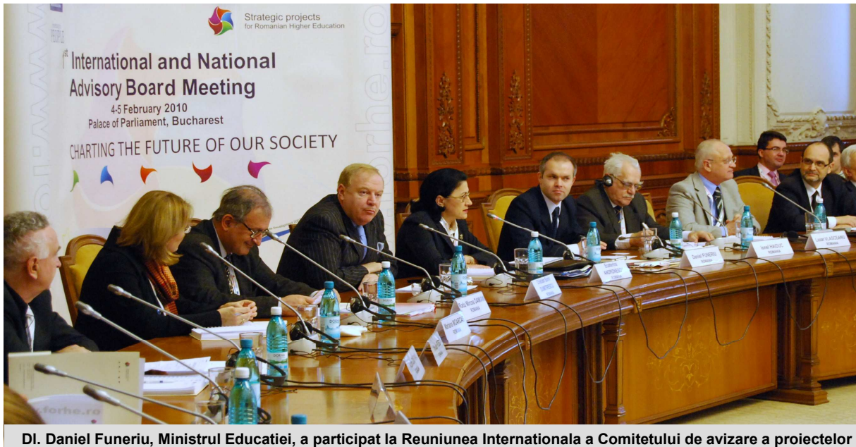
DI. Daniel Funeriu, Ministrul Educației, a participat la Reuniunea Internațională a Comitetului de avizare a proiectelor